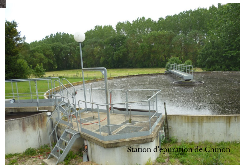
Station d'épuration de Chinon

"LE DIAGNOSTIC DE RACCORDEMENT CONSISTE À VÉRIFIER OÙ SE DIRIGENT VOS EAUX USÉES ET VOS EAUX PLUVIALES"